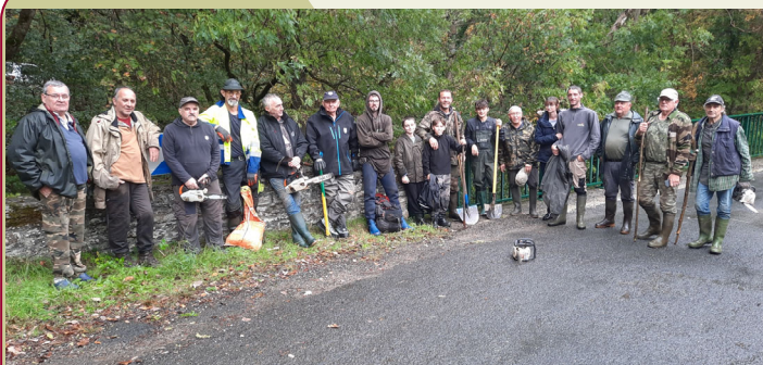
les bénévoles du nettoyage du Tenten fin octobre

aux jeunes. Le verre de l'amitié et le copieux déjeuner qui suivirent pour l'ensemble des participants ont favorisé l'ambiance et les échanges. Le 21 octobre, 4 jeunes accompagnés de 15 adultes ont