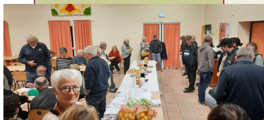
Belote grillade et soupe à l'oignon à Villemagne.