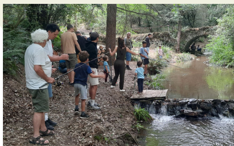
La pêche des plus jeunes début juillet

Depuis les dernières informations parues sur Info Verdun, la Truite Verdunoise, si elle a moins permis de « taquiner » la truite dans nos 2 ruisseaux du Tenten et de l'Aigubelle, n'est pas restée pour autant inactive. Le 5 juillet l'association a organisé un rassemblement des jeunes pêcheurs de la commune, au bord du Tenten. La plus part des jeunes avaient déjà bénéficié dans le cadre des activités réalisées à l'école, d'une intervention d'un agent de la fédération départementale de l'Aude. La grande famille des pêcheurs étaient réunis au bord du tenten, et les enfants ont pris un réel plaisir à pêcher. Les gardes de pêche bénévoles étaient présents et ont participé à la remise des prix