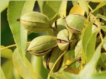
Noix de pécan Fruit du pacanier

Vincent Delonca espère populariser cet arbre impressionnant, capable d'atteindre 40 mètres de hauteur et de vivre plusieurs centaines d'années. Pour lui, planter un arbre, c'est faire un geste pour les générations futures. Une vision à long terme qui s'enracine parfaitement dans cette nouvelle pépinière, promesse de diversité et de durabilité.