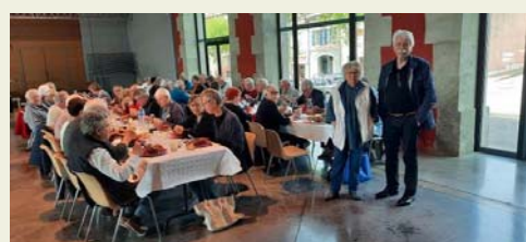
44 équipes engagées pour le Marathon de belote Verdun / Saint Martin Lalande et finale inter villages à Castelnaudary.