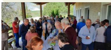
Omelette au village de vacances