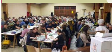
Oreillettes et loto aux Brunels.