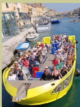
L'Étang de Thau