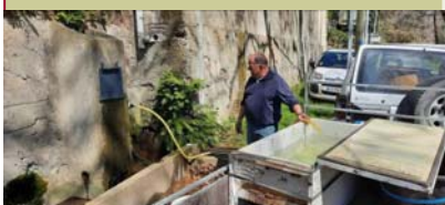
Le président prépare le 2ième lâcher.

La pêche Verdunoise a bien réussi l'ouverture du 11 mars, avec un premier lâcher de 80 kg qui a permis à l'ensemble des pêcheurs de ne pas revenir bredouilles. Le deuxième lâcher de 50 kg fut plus modeste pour nos pêcheurs locaux. Notre ruisseau du Tenten est très apprécié de nombreux pêcheurs venus souvent de très loin, ce qui déséquilibre un peu la gestion locale, et notamment le fait de financer une partie de lâchers par des fonds propres de l'association. Une réflexion sur ce sujet sera menée pour la saison prochaine.