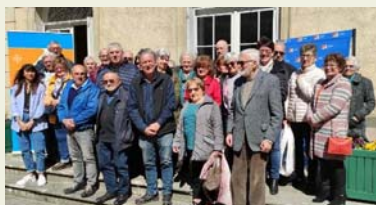
Les 2 groupes en visite à Villegly