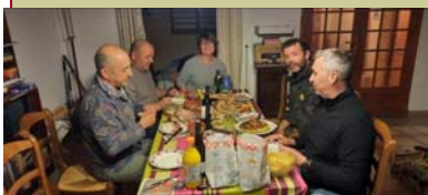
Nos pêcheurs locaux avant le départ pour l'ouverture...

L'association « la pêche Verdunoise » organise son animation pêche pour les jeunes au bord du Tenten (route des trois moulins, face au cimetière vieux).