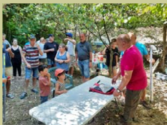
Fête de la pêche 2022