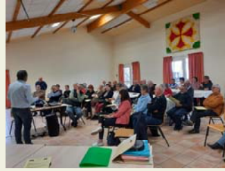
Assemblée Générale 2022