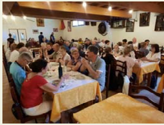
Domaine de Gaillac dans l'Aveyron