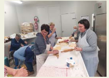
La confection des oreillettes