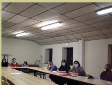
Assemblée Générale du 29 octobre 2021

Vous souhaitez nous aider à mettre en place les fêtes organisées à Verdun, n'hésitez pas à nous contacter par mail : comite.fetes.verdun.lauragais@gmail.com