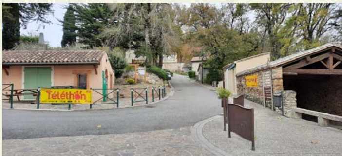
Comme dans de nombreuses communes, à Verdun des banderoles pour sensibiliser La population aux difficultés rencontrées par le téléthon en 2020 ont été posées