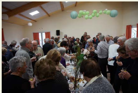
Cette année pas de repas final, pas d'apéro, pas de retrouvailles avec nos amis des Brunels et des Cammazes !