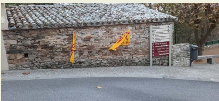
Résultat de la lâcheté d'une ou de plusieurs personnes ...merci pour les enfants handicapés et malades qui bénéficient au fil des années, des aides pour leur mieux être et des médicaments pour guérir !

Les bénévoles qui ont réalisés les 2304 nems à Villespy !