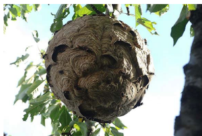
UNAF - Félix Gil

Son origine : On trouve en général cette variété dans le Nord de l'Inde, en Chine ou dans les montagnes d'Indonésie.